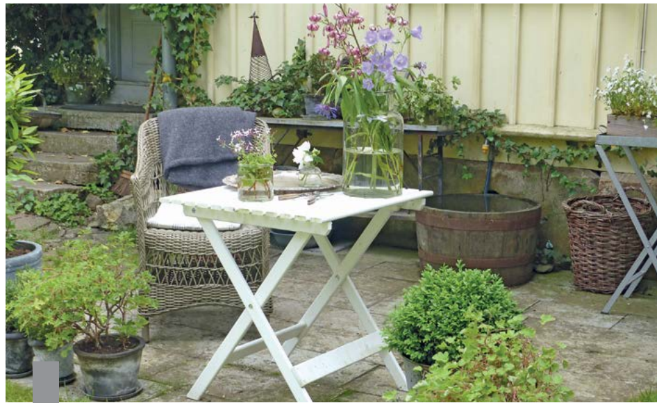
Die hohen Preise in den Großstädten sind für Immobilienkäufer und Mieter auf der Suche nach einem bezahlbaren neuen Zuhause frustrierend.

Seit der Jahrtausendwende zieht es die Menschen vermehrt in die Städte. Die Metropolen wuchsen. Dieser Trend setzt sich bis heute fort, doch einige große Städte wie Hamburg, München oder Stuttgart verzeichnen erstmals einen negativen Wanderungssaldo. Ein Grund sind die hohen Immobilienpreise und Mieten, denn für alle Metropolen gilt: Das Wohnen im Umland ist günstiger als in der Stadt. Das knappe Wohnungsangebot und die hohen Preise frustrieren die Nachfrager zunehmend und veranlassen sie, sich nach Alternativen umzuschauen. Der Blick geht an den Stadtrand, ins Umland oder in ländliche Gemeinden. Die haben über die günstigen Preise hinaus etwas zu bieten, was in der Stadt rar ist: die Nähe zur Natur, Entschleunigung, die Rückkehr zu Freunden und Familie. Laut aktuellem Baukulturbericht wollen 55 Prozent der 30- bis 40-Jährigen am liebsten in einer Landgemeinde wohnen, 27 Prozent in einer Mittel- oder Kleinstadt, aber nur 18 Prozent in einer Großstadt.