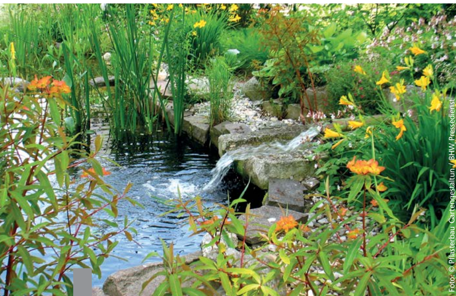
Kleine, private Rückzugsmöglichkeiten und Ruheinseln werden in Zeiten wachsender Städte und dichter Siedlungen immer wichtiger.

Auch der aller kleinste Stadtgarten bietet noch Platz für ein Stück Natur. Wer die Gestaltung geschickt angeht, kann ein kleines Paradies schaffen. Dabei kommt es auch auf kleinem Raum auf Vielfalt an. Wasser kann dabei eine wichtige Rolle spielen. Schon ein kleiner Teich bereichert die Natur, ist ökologisch sinnvoll und gut für das Klima. Nach Aussagen des deutschen Zentralverbands Zoologischer Fachbetriebe geht der Trend hin zu naturbelassenen Teichen. Bei diesen pendelt sich das ökologische Gleichgewicht im Gegensatz zu künstlichen Teichanlagen automatisch ein. Schon eine dreistufige Tiefenabfolge ahmt natürliche Bedingungen nach und bietet Pflanzen, Fischen, Amphibien und Insekten einen optimalen Lebensraum. Teichbauer oder Gartenbauarchitekten berücksichtigen bei der Planung nicht nur die Ausgangslage und den Bezug zum Gebäude, sondern achten darauf, dass der Teich keine Gefahr für Kinder und Haustiere darstellt. Frühjahr und Sommer sind der perfekte Zeitraum, um einen Teich anzulegen.