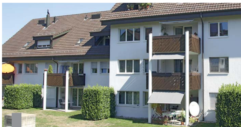
Eine offene Terrasse vor der Eigentumswohnung ist besonders im Sommer ein Gewinn an Lebensqualität und eignet sich prima für Aktivitäten im Freien.

Die Fläche der Terrasse zu erweitern, zu befestigen und gegen Blicke abzuschirmen ist ein nachvollziehbarer Wunsch der Wohnungseigentümer, die daran Sondernutzungsrechte haben. Eine Eigentümergemeinschaft hatte diesem Anliegen zugestimmt und beschlossen, dass die Kosten der Baumaßnahmen und künftigen Instandhaltung von den Nutzern zu tragen sind. So stand es auch bereits in der Teilungserklärung.